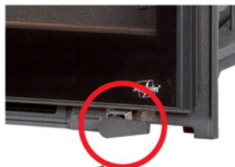
Poignée de commande

adaptable uniquement sur double combustion